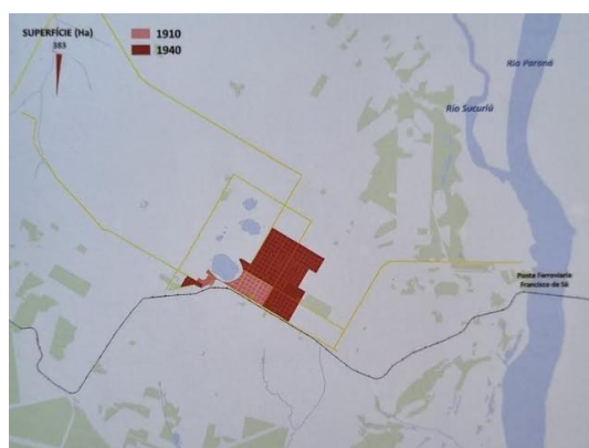
Figura 1 - Mancha Urbana com índice de habitantes de Três Lagoas comparativos das décadas de 1910 e 1940.

que ocorreu após a construção da ponte ferroviária pela Companhia Estrada de Ferro Noroeste do Brasil (CEFNOB). Os primeiros bairros foram projetados pelo engenheiro Oscar Guimarães, que projetou um traçado para uma população bruta de pelo menos 25 habitantes por hectare, com 25 quarteirões. Nesta época já existia um aeroporto ao sul da linha férrea, que funcionou até a década de 60, quando foi transferido para a beira do Rio Sucuriu.